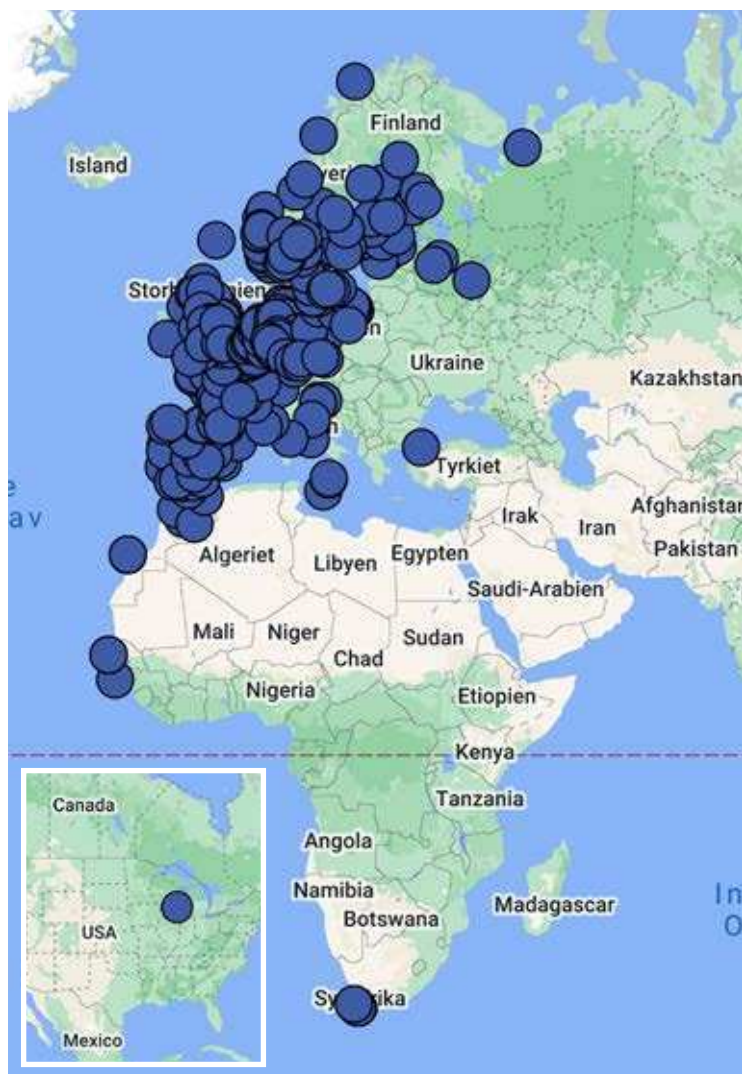
Figur 1. Den geografiske fordeling af genfund i udlandet af fugle ringmærket i Danmark, som er behandlet af Ringmærkningsadministrationen i 2021 (n=1.046).

Blandt genfund af fugle ringmærket i Danmark, var der 1.046 fugle