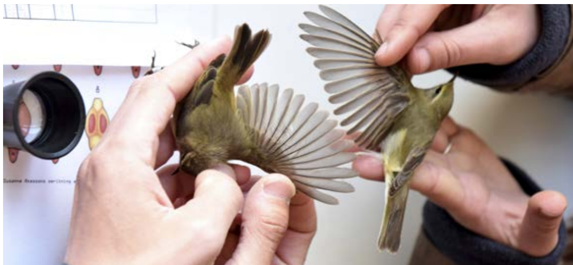
Løv- og gransanger fanget på Blåvand Fuglestation, 25. april 2021.