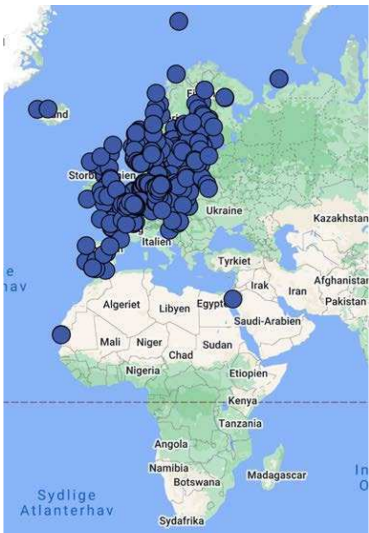
Figur 2. Den geografiske fordeling af mærkningslokaliteter for fugle ringmærket i udlandet og genmeldt i Danmark, som er behandlet af Ringmærkningsadministrationen i 2021 (n=946 fugle med 1.239 genfund).

De 1.239 genfund i Danmark af fugle ringmærket i udlandet omfatter i alt 958 forskellige individer fra 21 lande inkl. Island i nordvest (grågås & Islandske ryle), Rusland i nordøst (bramgås), Mauretanien i sydvest (Islandske ryle) og Israel i sydøst (gærdesanger) (fig. 2).