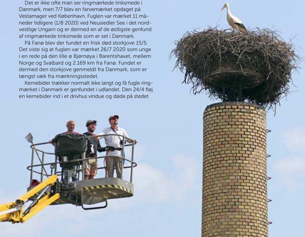
I 2021 mærker museet fem hvide storkeunger med GPS-sendere i samarbejde med foreningen Storkene.dk. Gundsølleie, 19. maj 2021.

Genfund eller aflæsninger af ringmærkede fugle bør indsendes via www.fuglering.dk