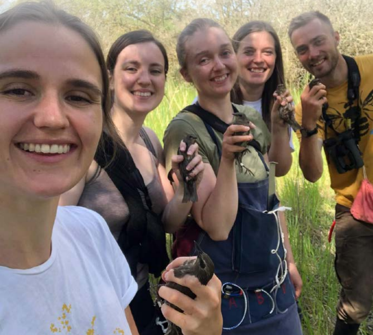
Ringmærkningsprojektet Constant Effort Sites (CES) er et vigtigt projekt som bidrager til overvågning af de almindelige danske småfuglebestande. Her er det teamet på CES-Vestamager 15. juni 2021 klar til at frigive en flok stære.

2021 er et rekord år for antal mærkede dværgterner med 288 fugle. Tidligere rekord var på 178 fra året før. For dværgterne er der ligeledes tale om målrettet projektmærkning. Som et kuriosum er i 2021 ringmærket lille stormsvale (2) og tredækker (4), to arter der tidligere er mærket meget få af i Danmark (hhv. 6 og 5 fugle). I 2021 er også ringmærket mange kirkeugler og vende-halse men relativt få sildemåger og slørugler. Generelt er i 2021 ringmærket meget få ænder og rovfugle, blandt andet er duehøg og rød glente slet ikke mærket dette år.