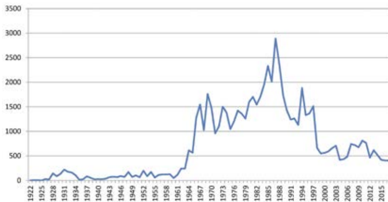
Figur 4. Antal ringmærkninger fordelt pr. år af broget fluesnapper i Danmark til og med 2017.

varierende mellem 169-201. I 2017 var de personlige licenser fordelt på 91 A-licenser, 38 B-licenser, 22 C-licenser og 46 X-licenser. En licens er gældende for et år ad gangen, og alle, der ringmærker fugle, skal have en gyldig personlig licens. Yderligere information om licenser findes på RCs hjemmeside ( www.rc.ku.dk – side 22 i Retningslinjerne).