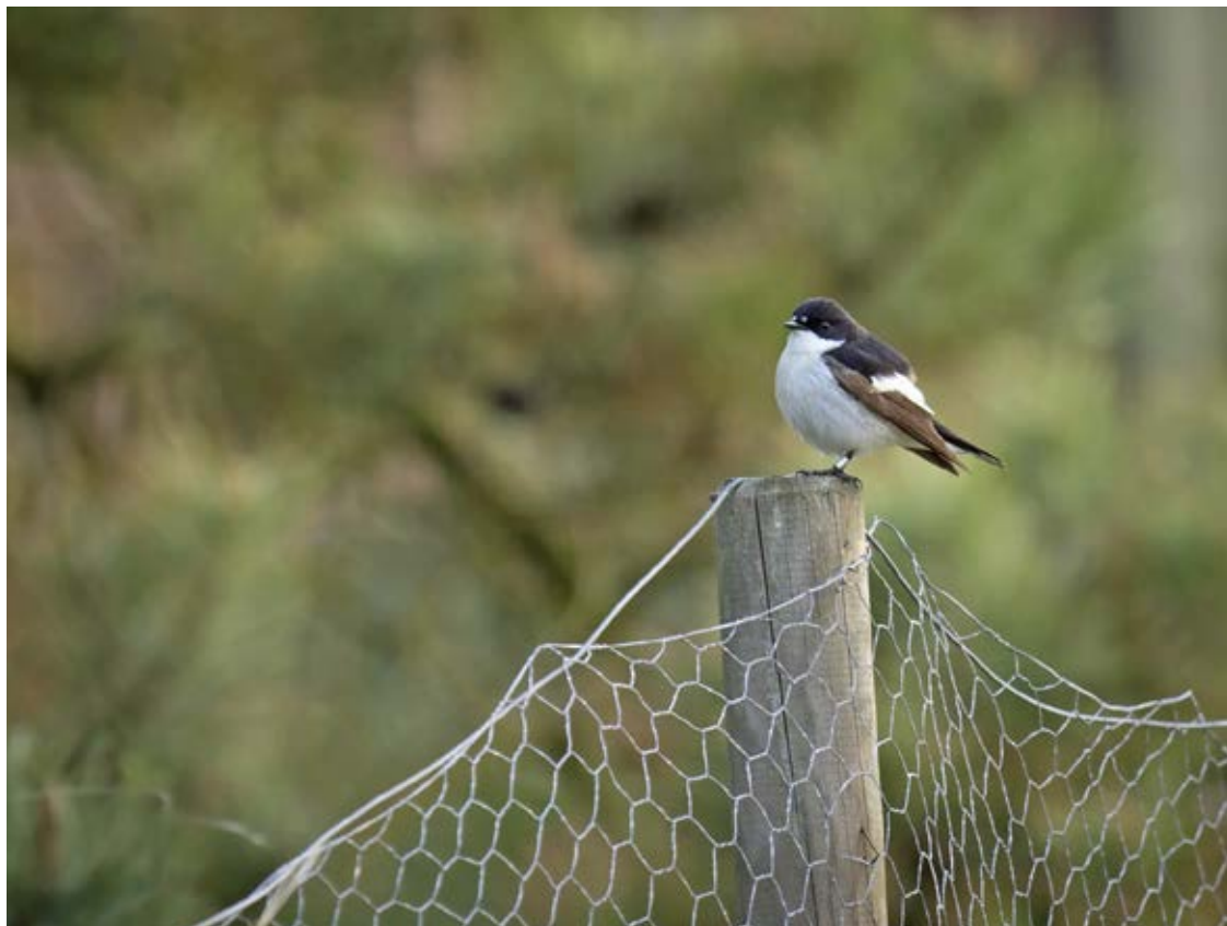
Broget fluesnapper, Blåvand, 6. maj 2017.