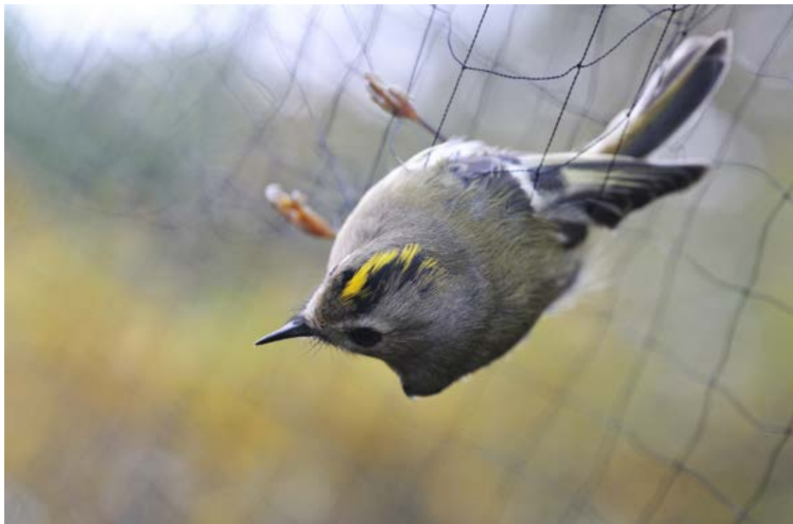
Fuglekonge i spejlnet, Blåvand, 16. oktober 2017.

en smule over gennemsnittet for perioden 1999-2016, som er på 84.430 mærkninger pr. år. 1998 var et skelsættende år for ringmærkningen i Danmark – ringmærkningen var gennem en større revidering som medførte vedtagelse af en strategi og retningslinjer for fremtidige aktiviteter.