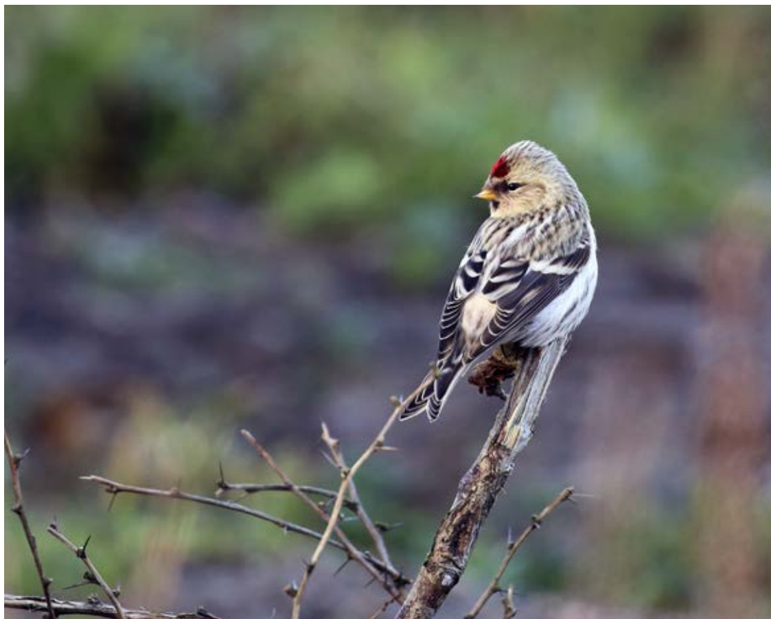
I 2017 blev der ringmærket ikke mindre end 102 hvidsissen i Danmark. Her fra Skagen 10. december 2017.

fra 33 ringmærkningscentraler inkl. Ukraine, Israel og Egypten, og det var dermed et af de største arrangementer i EURINGs historie.