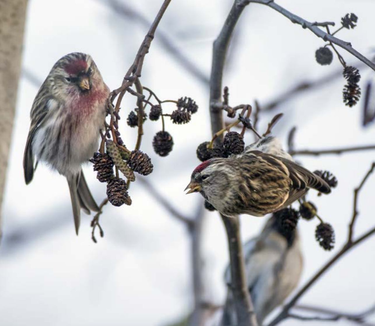
Stor gråsisken, Nexø, 8. december 2017.