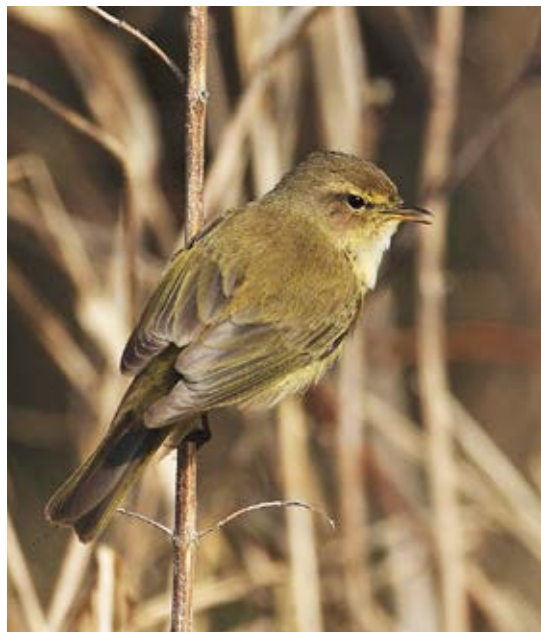
Gransanger, Hellebæk Kohave, 3. april 2017.

I 2017 var syv ringmærkergrupper (RG) aktive i Danmark: Nordjysk RG, Nordvestjysk RG, Østjysk RG, Anholt RG, Fyns RG, Sydvestsjælland RG og Lolland-Falster-Møn RG. Flere af de mest aktive grupper er involveret i forskellige mærkningsprojekter, f.eks. CES-projektet og/eller har en fuglestation tilknyttet.