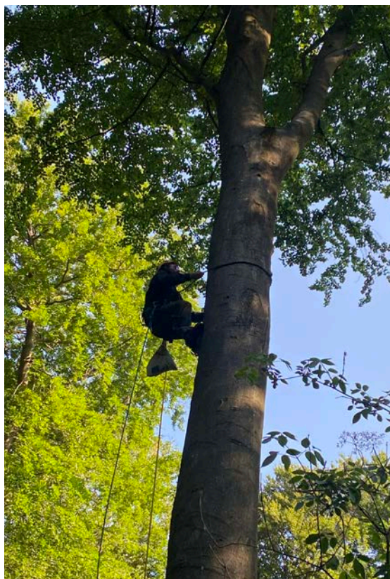
Det kræver erfarne træklatrerere for at nå op til reder af Rød Glente. I 2023 mærkede museet ni unger af Rød Glente med GPS-sendere, i samarbejde med LIFE EUOKITE. Fyn, 29. juni 2023.