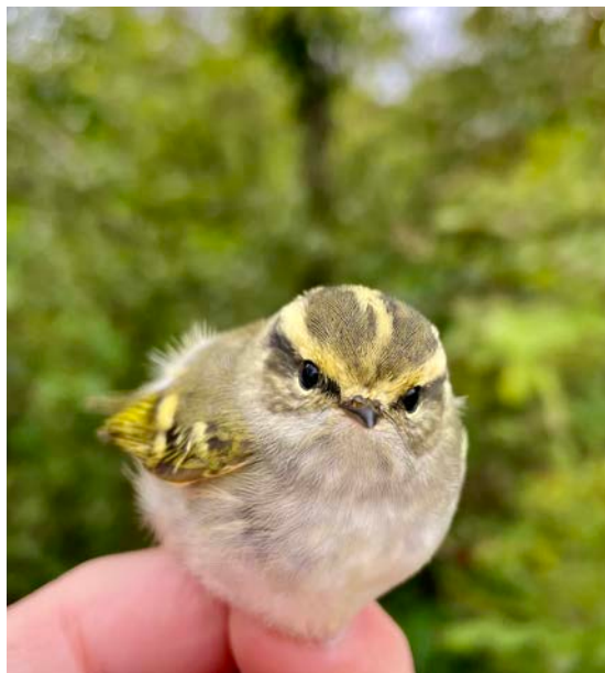
Fuglekongesanger 1K, Christiansø 25. oktober 2023.

Under Fåtallige Ynglefugle-projektet er mange delprojekter, typisk artsprojekter, som ikke nødvendigvis ringmærker mange fugle, men i stedet nøje følger ind- og udvandring af de fåtallige arter. I 2023 begyndte museet sammen med det europæiske projekt LIFE EUOKITE at sætte GPS-sendere på unger af Rød Glente. I alt 9 unger blev mærket, alle på Fyn. GPS-mærkningen af Hvid Stork, i samarbejde med storkene.dk, fortsatte på tredje år, hvor seks unger fik påsat GPS-sendere. Fuglene kan følges på fuglerejsen.dk. Et nyt delprojekt startede i 2023 under ledelse af Århus Universitet, hvor 19 Rovterne-unger blev mærket ved Møn.