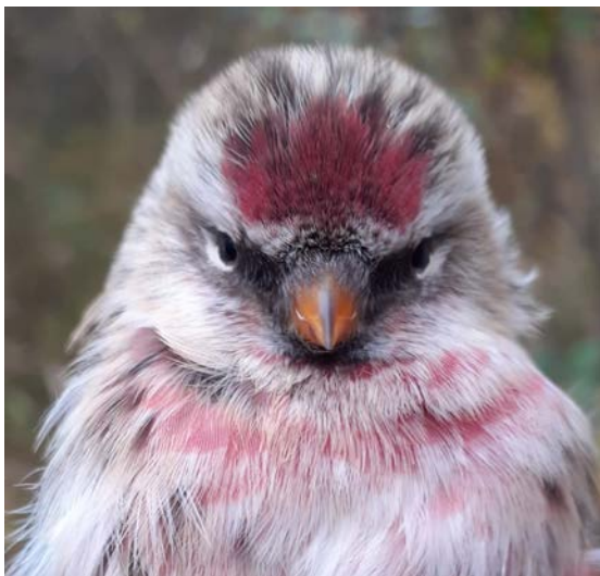
Foto: Gråsisken, Skagen Fuglestation 24. oktober 2023. I 2023 blev der ringmærket mange Gråsisken i Danmark, det tredje højeste antal nogensinde.