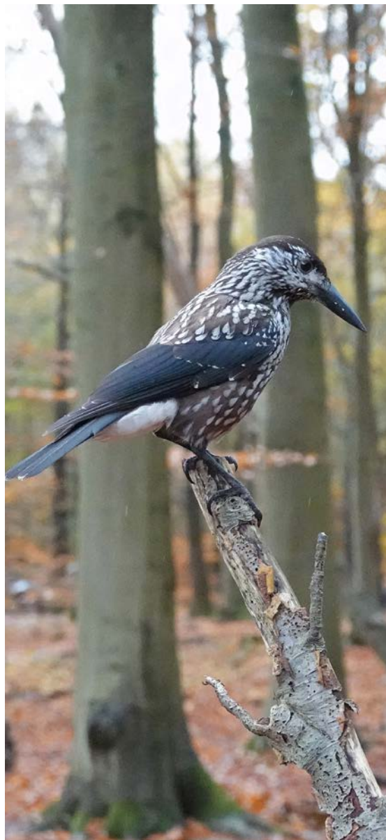
Tyndhæbbet Nøddekrige, Ravnholt, 11. november 2023.

Genfund eller aflæsninger af ringmærkede fugle bør indsendes via www.fuglering.dk – alternativt per e-mail til ringing@snm.ku.dk