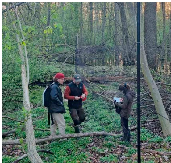
CES-mærkning Rungstedlund 27. april.