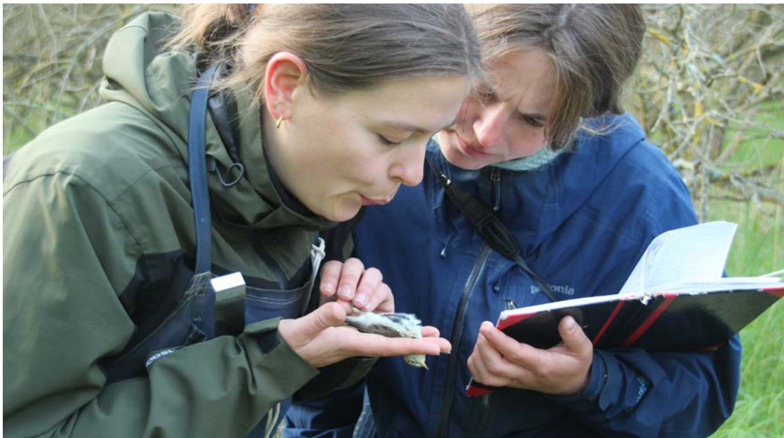
Naturovervågningen af ynglende småfugle ved hjælp af ringmærkning, også kaldet CES-projektet, blev i 2023 gennemført på otte lokaliteter: Skagen, Tømmerby Fjord, Brabrand Sø, Ribe, Lunget, Svendborg, Vestamager og Rungstedlund. Vestamager 23. maj.

I Danmark begyndte CES-projektet i 2004 i samarbejde med Danmarks Ringmærkerforening. I sommerhalvåret 2023 er der ringmærket 2.241 og aflæst 759 fugle på 8 faste lokaliteter. Mellem 30-40 ringmærkere deltager i projektet. Læs mere i særskilt omtale her i Fugleåret.