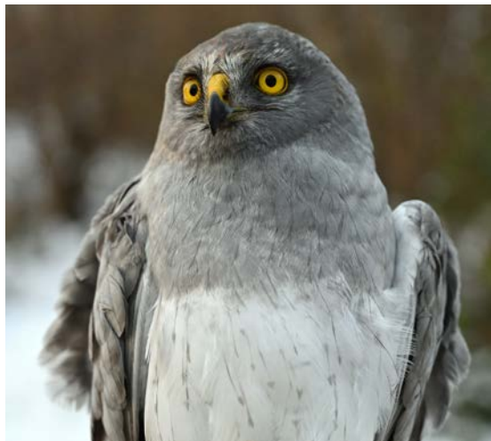
Ringmærket Blå Kærhøg han 2k, Gedser Fuglestation 5. december 2023. Det hører til sjældenhederne at ringmærke en Blå Kærhøg i Danmark. Denne fugl er blot den tredje siden 1998. I alt er der ringmærket 76 Blå Kærhøg i Danmark.

Flere ikke-spurvefuglearter er ringmærket i rekordhøje antal i 2023: Skovsneppe med 334 fugle (tidl. rekord: 318 i 2022), Tredækker med 14 fugle (tidl. rekord: 5 i 2022), Rovterne med 19 fugle (tidl. rekord: 4 i 2022) og Vende-hals med 321 fugle (tidl. rekord: 229 i 2022). I det hele taget er der ringmærket usædvanligt mange vadefugle i 2023, hele 676 fugle fordelt på 23 arter, som tæller, udover de allerede nævnte, bl.a. Hvidbrystet Præstekrave (23 fugle), Enkeltbekkasin (59) og Dobbeltbekkasin (122). Mange af vadefuglene er fanget om natten med brug af termiske kikkert. Det store antal mærkede Vende-halse skyldes primært ynglefuglemærkning i områderne ved Borris Hede og i Vendsyssel.