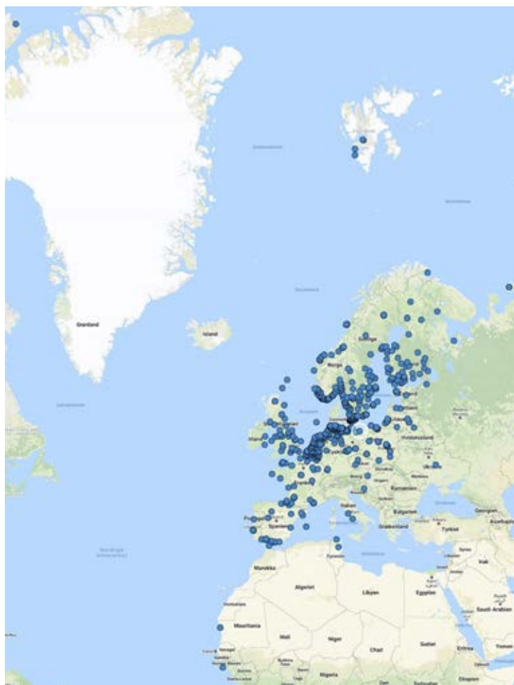
Figur 2. Den geografiske fordeling af mærkningslokaliteter for fugle ringmærket i udlandet og genmeldt i Danmark, som er behandlet af Ringmærkningsadministrationen i 2020 (n=995 fugle med 1.311 genfund).

Genfund eller aflæsninger af ringmærkede fugle bør indsendes via www.fuglering.dk .