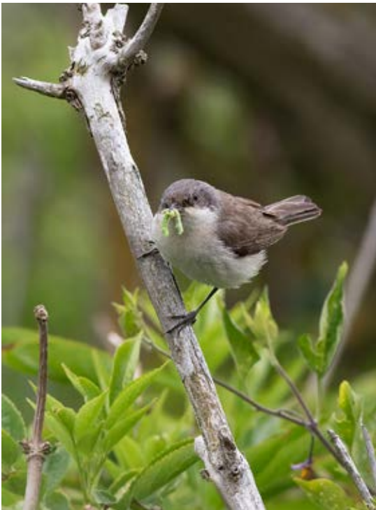
Gærdesanger, Harboøre Tange, 10. juni 2020.