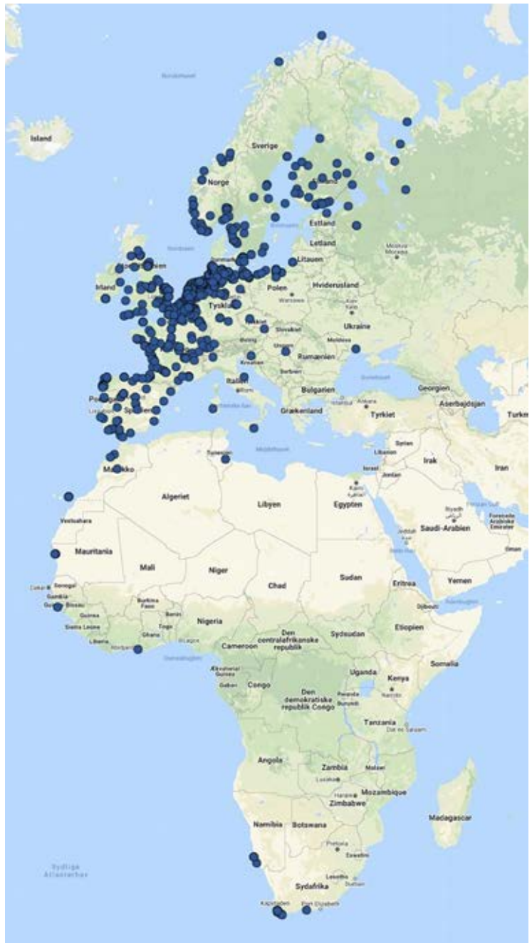
Figur 1. Den geografiske fordeling af genfund i udlandet af fugle ringmærket i Danmark, som er behandlet af Ringmærkningsadministrationen i 2020 (n=837).

Blandt genfund af fugle ringmærket i Danmark var 837 genmeldinger