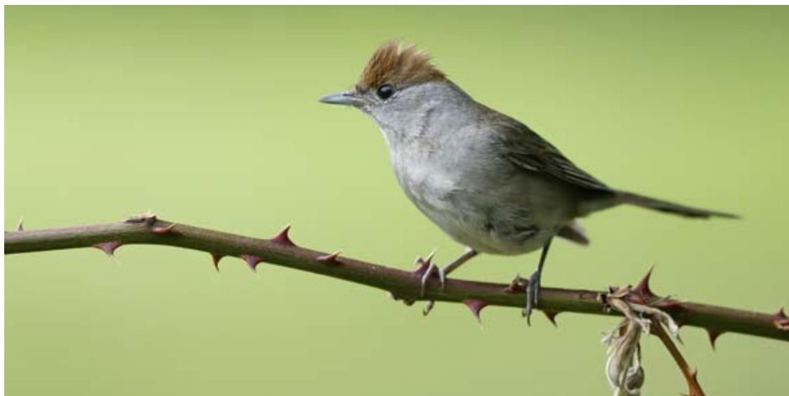
Munk, Gl. Holte, 27. maj 2020.

På Ringmærkningsadministrationens blog ( https://fuglering.sites.ku.dk/ ) bringes spændende, interessante og sjove historier fra ringmærkningsverden inkl. genfund. Genmelding i Danmark af ringmærkede fugle – uanset om det er en dansk eller udenlandsk ring – bør ske her: www.fuglering.dk