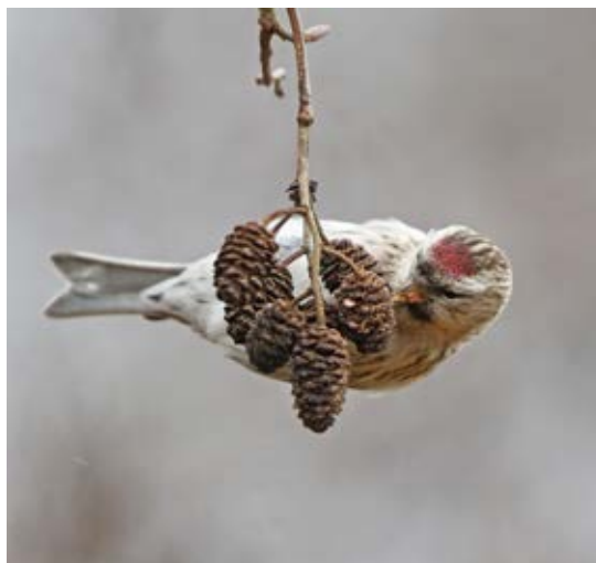
Gråsiskan, den talrigest ringmærkede art i 2018. Nivå, 21. januar 2018.

Genfund eller aflæsninger af ringmærkede fugle bør indsendes via www.fuglering.dk .