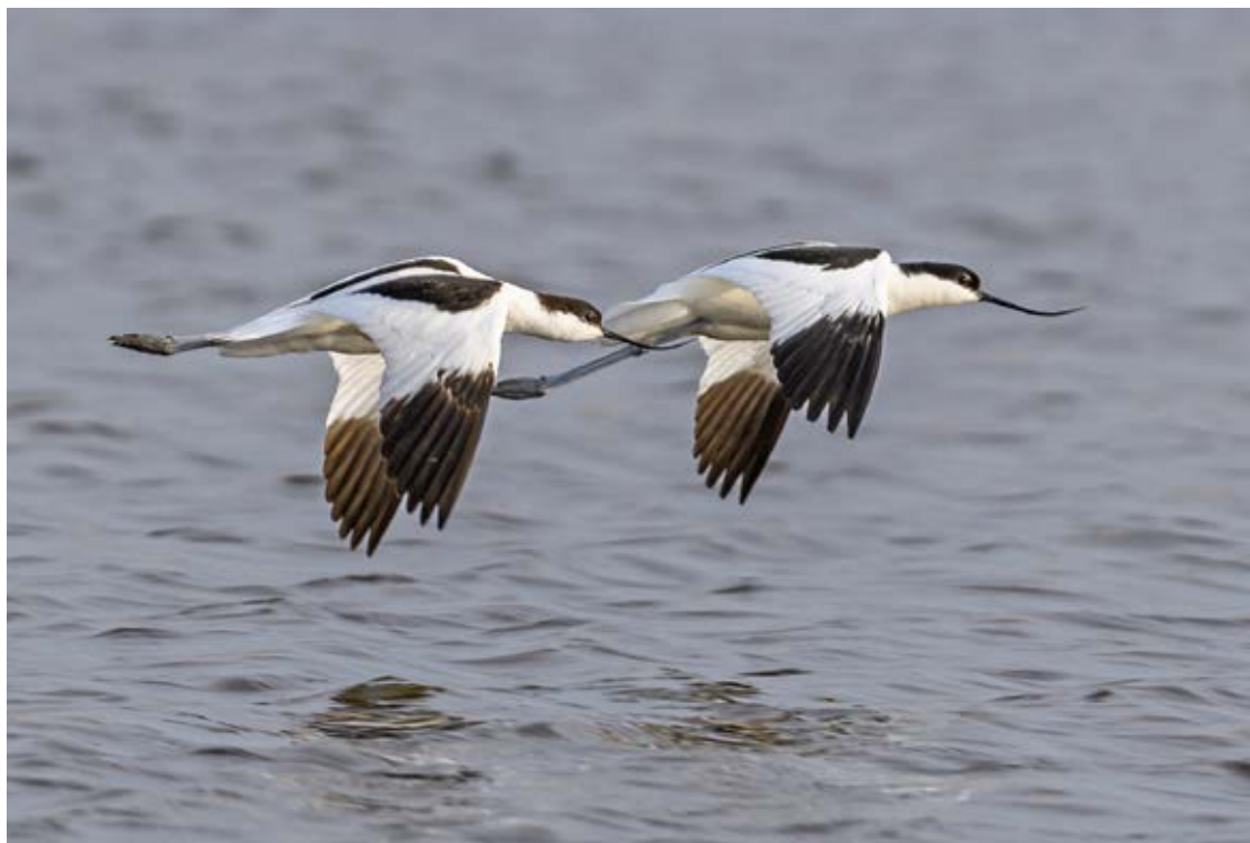
Klyde, Borreby Mose, 13. april 2018.