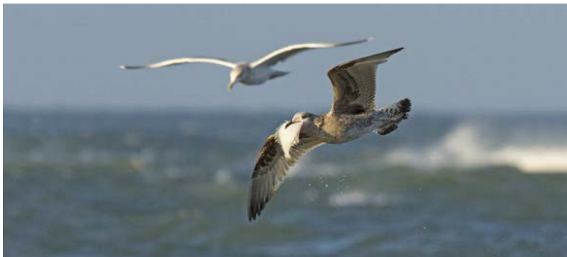
Sølvmåge, Blåvands Huk 17. november 2018.