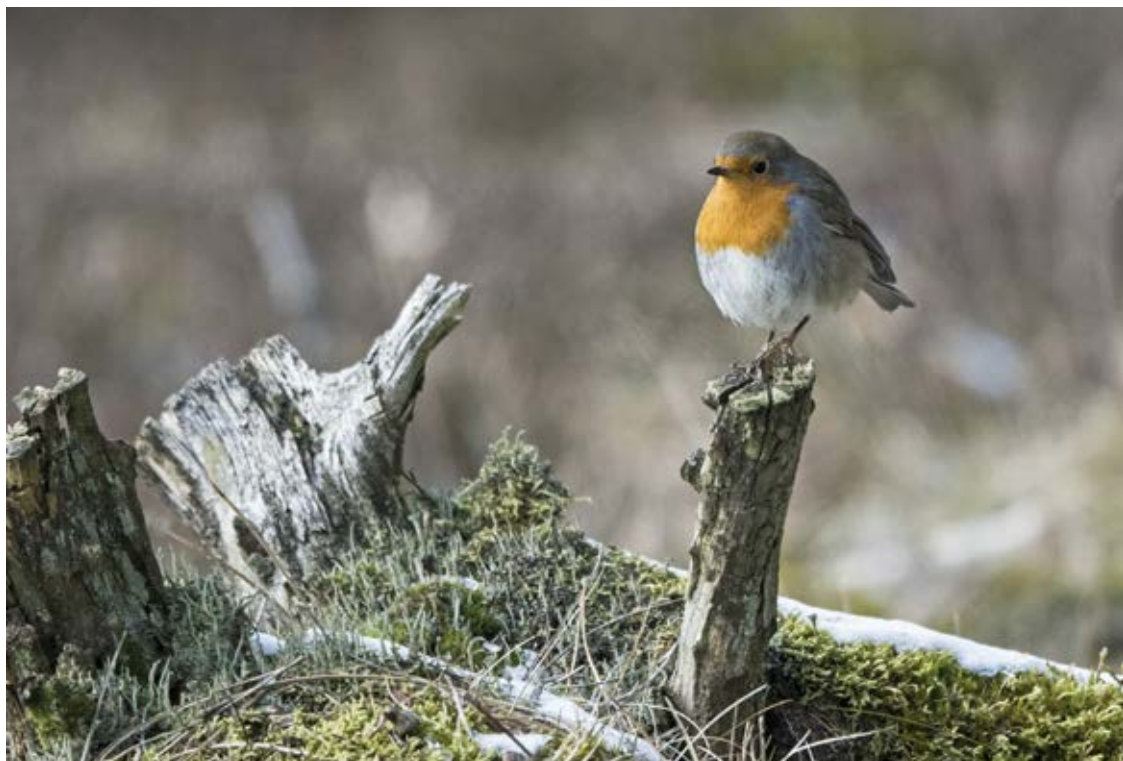
Rødhals, 5090 rødhalse blev mærket i 2018. Tvorup Klitplantage, 28. februar 2018.

I 2018 blev der behandlet 2.962 genmeldinger, fordelt på 1.984 genmeldinger af fugle ringmærket i Danmark, samt 978 genmeldinger i Danmark af fugle ringmærket i udlandet (se tabel 2). For Færøerne blev der behandlet hhv. 53 og 66 genmeldinger. Genmeldingstallene indeholdt ikke aflæsninger af farveringer fra de store og