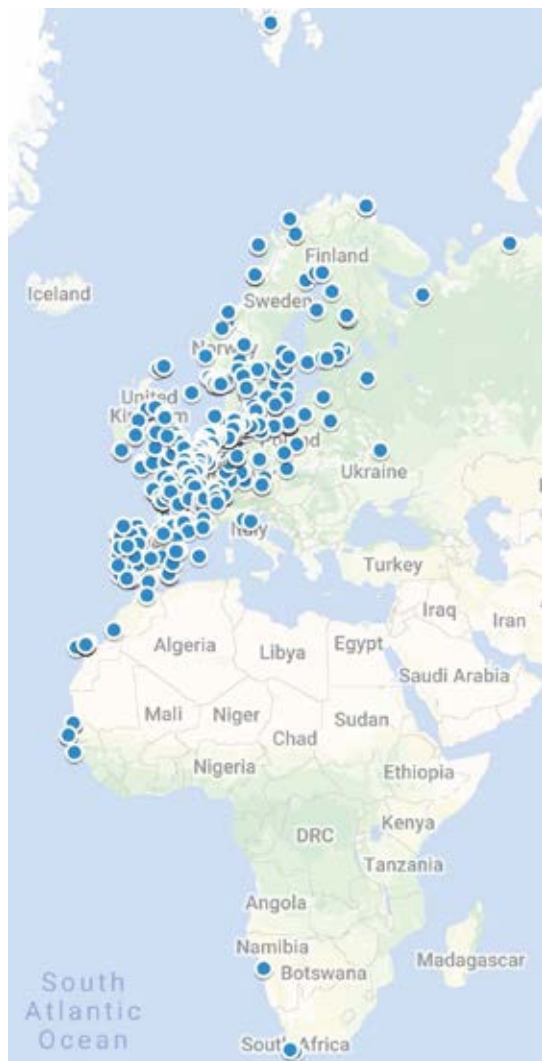
Figur 1. Den geografiske fordeling af genfund i udlandet af fugle ringmærket i Danmark, som blev behandlet af Ringmærkningscentralen i 2018 (n=1.105).