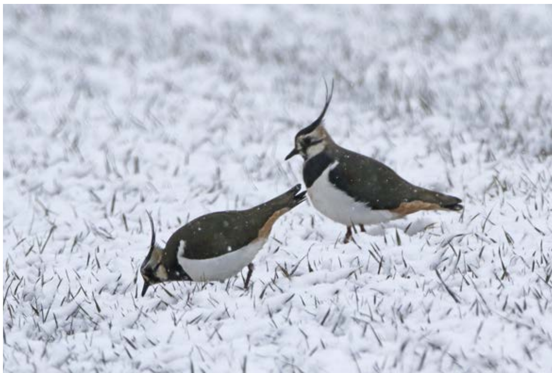
Vibe, Ø. Sømark, 27. Marts 2018.