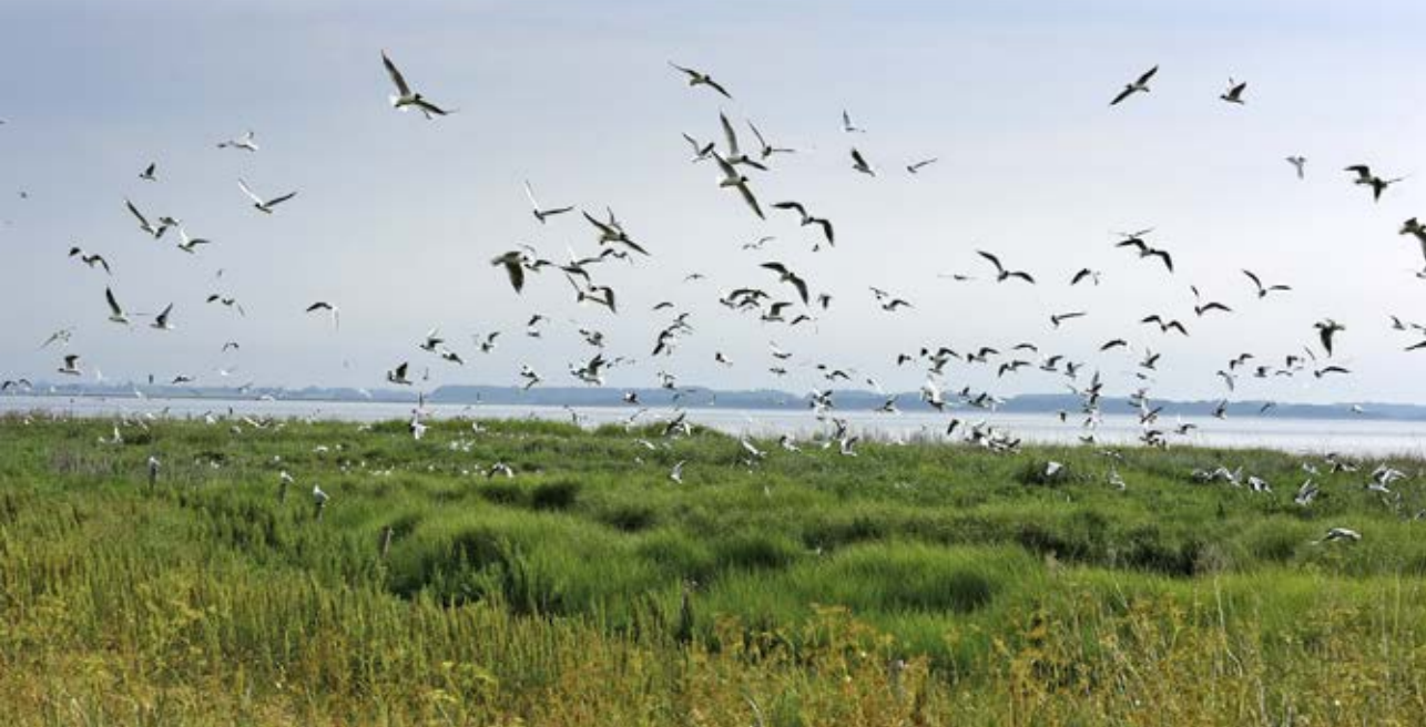
Hættemåge, Hjørnø, 10. juni 2018.

På Færøerne blev der ringmærket 7.280 fugle fordelt på 18 arter hvoraf 4 var spurvefuglearter. Det samlede antal var på et højt niveau, mens antallet af arter var meget lavt. Talrigeste mærkede arter blev lille