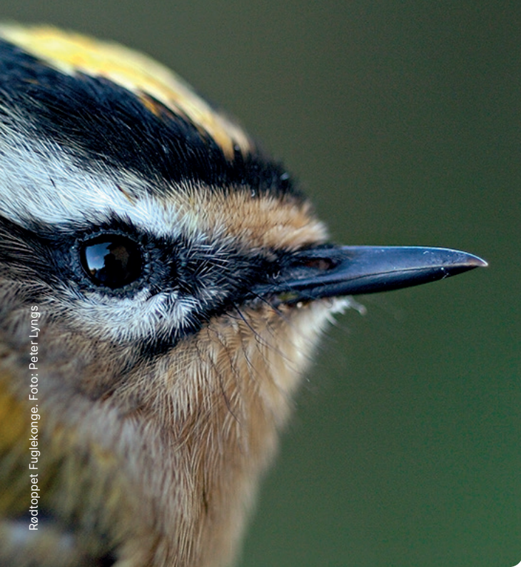
Rødtoppet Fuglekonge.

Du kan læse mere om ringmærkning på vores hjemmeside www.rc.ku.dk eller ved at kontakte os på