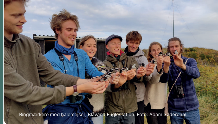
Ringmærkere med halemejsler, Blåvand Fuglestation.

Hvis man finder en ringmærket fugl og sender dens oplysninger til Ringmærkningsadministrationen, bidrager man til både forskningen og forvaltningen af de danske fugle. Som tak modtager du en rapport med ringmærkningsdata og fuglens kendte livshistorie.