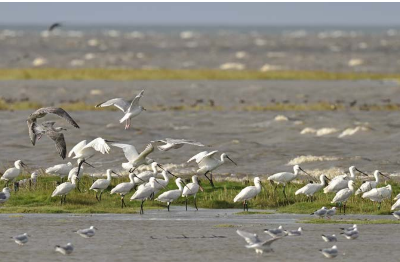
Stektorke i marsken, bemærk farveringene på flere af fuglene. I 2016 blev der aflæst 98 danskmærkede og 8 udenlandske farvering på skektorke i Danmark. Højer Sluse, 11. september 2016.

Også i 2016 bidrog ringmærkningen med dokumentation af flere SU-arter og fåtallige, sjældne arter. Blandt SU-arterne blev ringmærket sibirisk jernspur (13/10, Christiansø, blot 2. fund i Danmark dette ef-