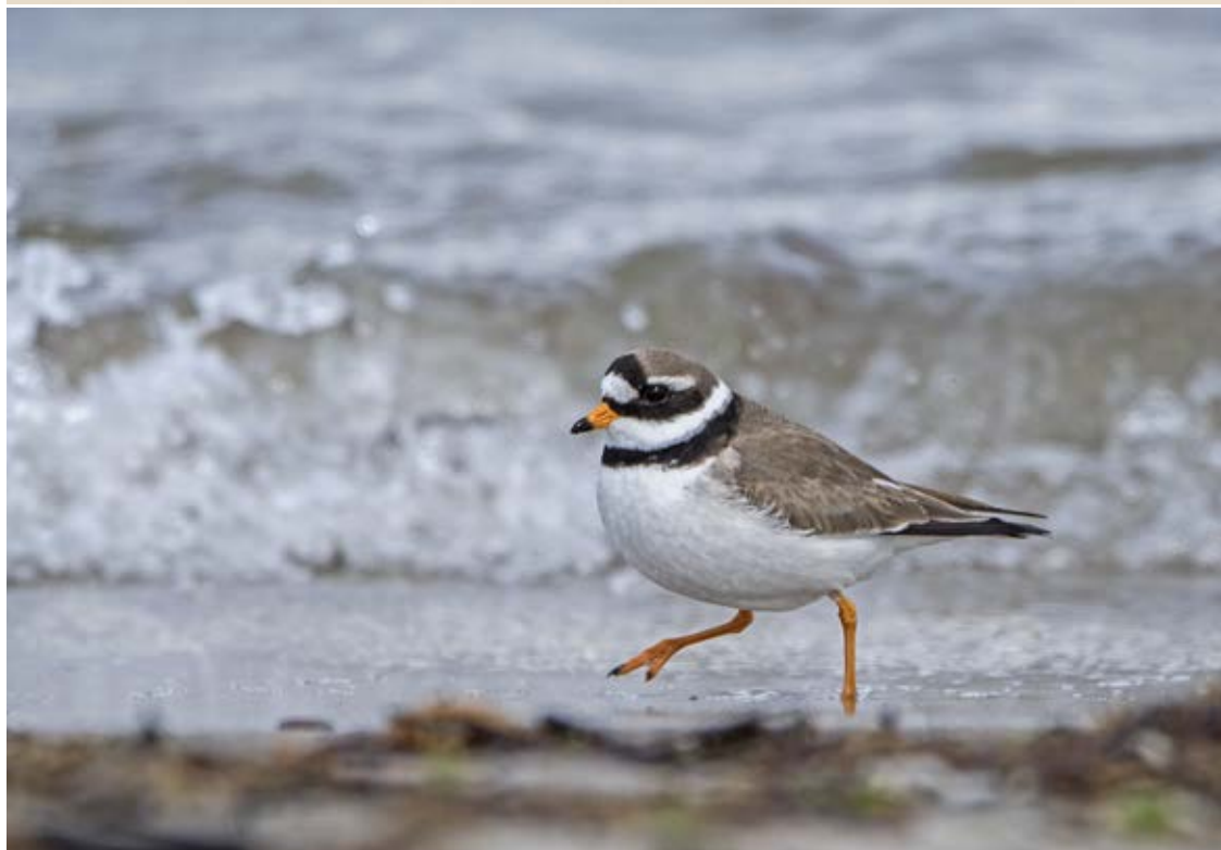
Øverst: Islandsk ryle, Blåvand, 1. oktober 2016.