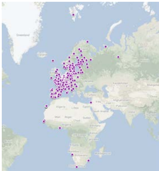
Figur 1. Den geografiske fordeling af genfundet i udlandet af fugle ringmærket i Danmark og som er behandlet af Ringmærkningscentralen i 2016 (n=1.050).