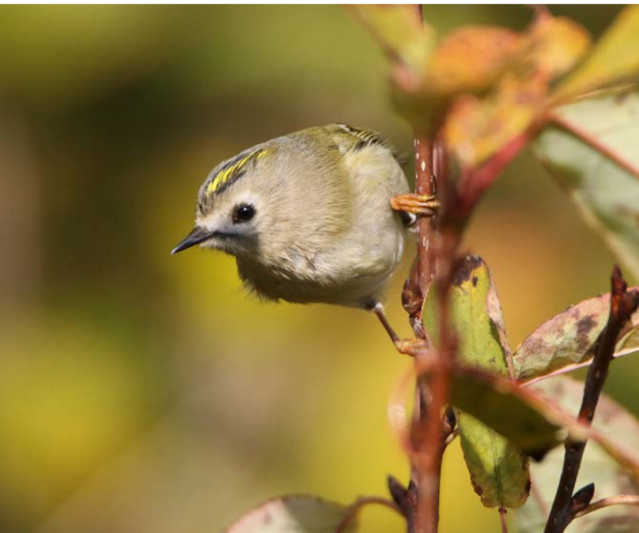
Fuglekonge, Myretauan, 22. oktober 2016.

Til sidst vil Ringmærkningscentralen gerne benytte lejligheden til at takke alle vore ringmærkere for deres store indsats i 2016 – tak for hjælpen. Endvidere vil vi takke alle, der på den ene eller anden måde har bistået ringmærkningen i 2016.